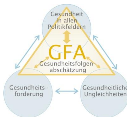
Abbildung 1: Verortung der GFA

Die wichtigsten Einflussfaktoren auf die Gesundheit der Bevölkerung befinden sich außerhalb des Gesundheitssystems (z. B. in Sozial-, Umwelt-, Arbeitsmarkt-, Verkehrs-, Wirtschafts- oder Bildungspolitik). Um die Gesundheit und Lebensqualität der Bevölkerung auf breiter Basis wirksam und nachhaltig zu fördern, ist die Zusammenarbeit aller politischen Ressorts unumgänglich. Die gesundheitspolitische Strategie „Gesundheit in allen Politikfeldern“ verfolgt das Ziel, sämtliche Ressorts bezüglich der gesundheitspezifischen Auswirkungen politischer Entscheidungen zu sensibilisieren und so Gesundheit als Querschnittsthematik zu verankern.